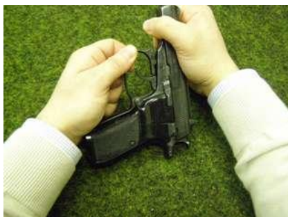
Obrázek 22: Vysunutí lučíku